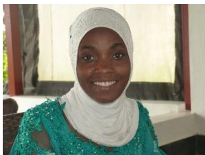
Studente(StAP) die een lange reis heeft gemaakt om ons te groeten( StAP-reis 2019)

In Oeganda leidt men op tot verpleegkundige of tot verloskundige. De opleiding is op het niveau van verpleegkundige (Registered) of op niveau van ziekenverzorgende (Certificate).